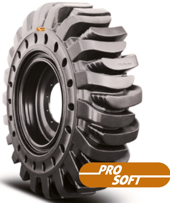
HPS Solidflex Traction